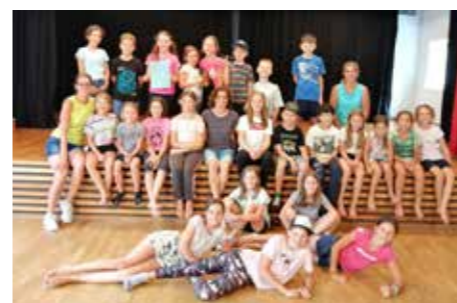
Ministranten und Singflöhe haben bei gemeinsamen Aktivitäten Spaß.