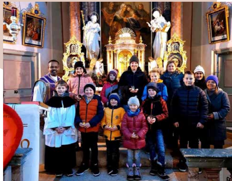
Zu Beginn der Adventzeit war in Ochsengarten einiges los - bei einem Bastelnachmittag im Widum wurde fleißig gewerkelt, beim Familiengottesdienst am 1. Adventssonntag stellten sich die Firmlinge vor und die Messe wurde von den Kindern gemeinsam gestaltet.

Text und Fotos: Claudia Heiss, PGR-Obfrau