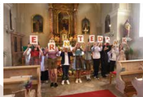
Text und Fotos: Bettina Neurauter

Auch in Ochsengarten wurde zur Erntedankfeier Anfang Oktober der Gabentisch reich geschmückt.