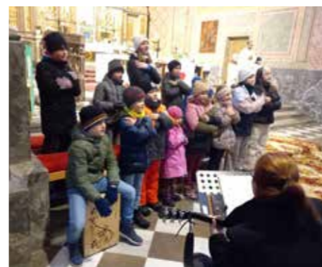
Die Singflöhe beim Einsatz in der Hl. Messe.