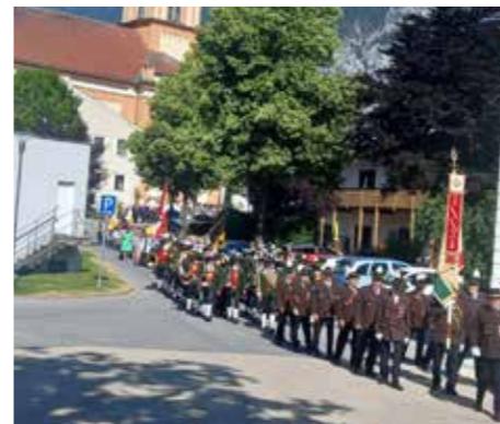
Vereine bei der Prozession.