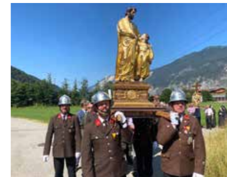
„Farggele“ Tragen ist Ehrensache.