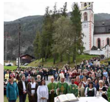
Einige Pfarrkirchen- und Pfarrgemeinderät:innen aus allen Pfarren nach der Messe.