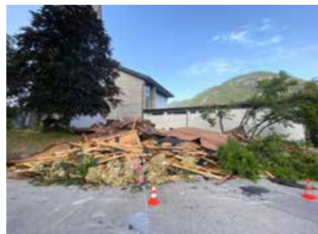
Die Trümmer des Daches kamen auf Straße und Grünfläche zu liegen.