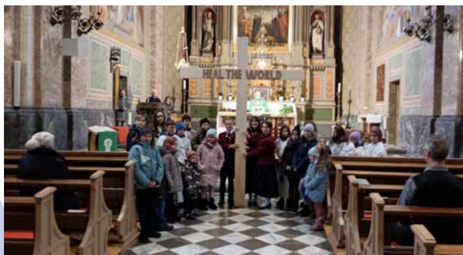
Unter den Klängen von „Heal the World“ setzten die Kinder ein Zeichen für den Frieden.