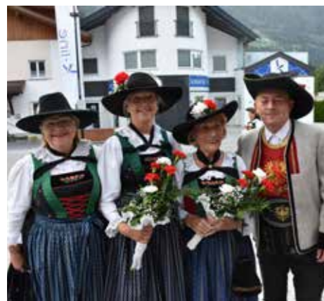
Viele Vereine und Abordnungen nahmen am Startfest teil.