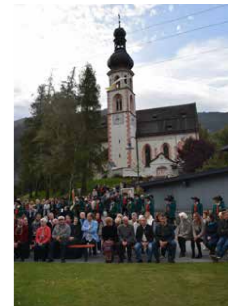
Feldmesse beim Kriegerdenkmal unterhalb der Pfarrkirche Haiming.