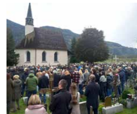
Es gibt traurige, aber auch freudige Anlässe in der Feier, die zum Leben dazugehören.