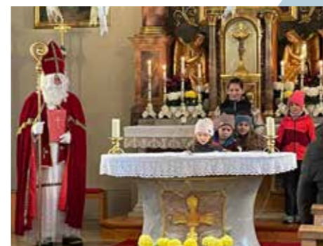
Der Nikolaus kam am 2. Dezember zu Besuch.

Der Advent (lat. „adventus“) bedeutet „Ankunft“ und in diesem Sinne möchten auch wir am Haimingerberg diese schöne Zeit dafür nutzen „anzukommen“ und „zusammenzukommen“. Für die Gestaltung der Feierlichkeiten in der Adventzeit wird der Pfarrgemeinderat von verschiedenen Vereinen unterstützt. Die Bäuerinnen binden jedes Jahr den Adventkranz, der am ersten Adventsonntag mit den Adventkränzen der Bevölkerung gesegnet wird. Die Jungbauern organisieren die Nikolausfeier, bei der ein Wortgottesdienst mit dem Hl. Nikolaus abgehalten wird und die Kinder Nikolaussäckchen bekommen. Im Anschluss an die Nikolausfeier findet ein Adventsmarkt mit gemütlichem Beisammensein statt, den die Jungbauern gemeinsam mit der Schützenkompanie Haimingerberg veranstalten. Außerdem besorgen die Jungbauern die Christbäume für die Kirche.