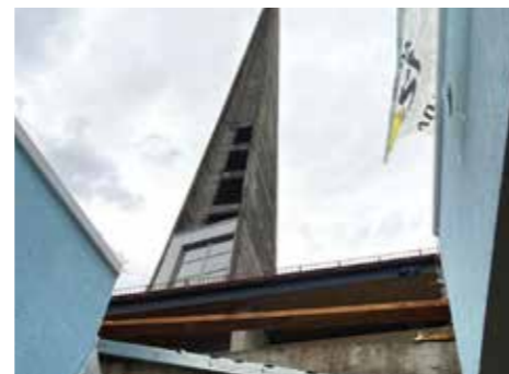
Hier fehlte plötzlich ein Dachfenster, anfangs regnete es ungehindert ins Innere.