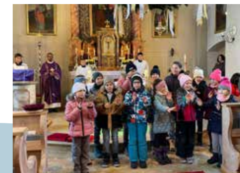
Familiengottesdienst am 3. Dezember.