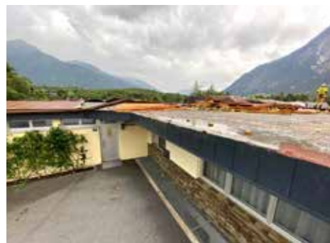
Der Großteil des Daches – Blech, Holz und Dachfenster wurden heruntergerissen.