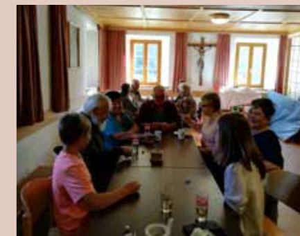
Die Huangartstube ist Treffpunkt für Jung und Alt.

Meistens trifft sich die Huangartstube am Donnerstag - für die genauen Termine bitte den Aushang bei der Kirche beachten.