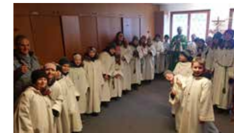
Die Minis im Einsatz.