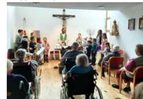
Die „Singflöhe“ zu Besuch im Haus Elisabeth, um die Bewohner:innen zu besuchen und den Gottesdienst mitzugestalten.