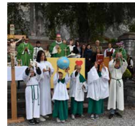
Die Minis hielten bei der Messe Symbole des Miteinanders hoch.