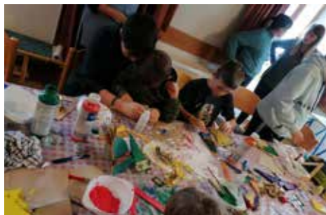
Am 25. November wurde im Widum fleißig gebastelt.

Am Samstag, den 25. November, fand im Pfarrsaal von Ochsengarten ein kreativer Nachmittag für Kinder statt. Die kleinen Gäste konnten verschiedene Bastelarbeiten aus Naturmaterialien anfertigen. Ob Tannenzapfen, Moos, Zweige oder Nüsse – alles wurde zu schönen Dekorationen, Geschenken oder Spielzeugen verarbeitet. Die Kinder konnten ihrer Fantasie freien Lauf lassen und dabei viel Spaß haben.