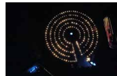
Labyrinth der Bäuerinnen.