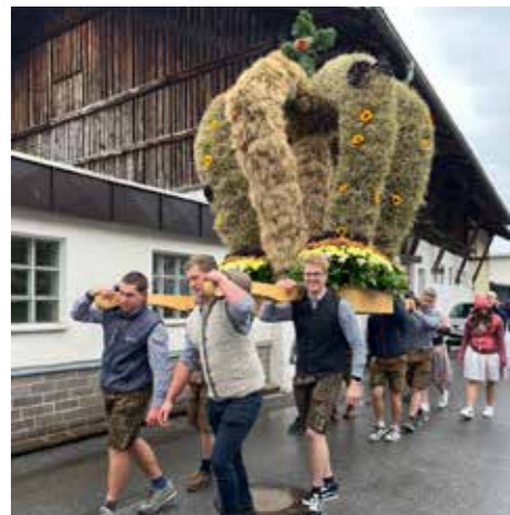
In Silz tragen die Jungbauern/Landjugend stolz die Erntedankkrone.

Das Erntedankfest nimmt in allen unseren Pfarren einen wichtigen Stellenwert ein. Gefeierte wurde im Oktober und alle Kirchen wurden, der Tradition entsprechend, mit den Gaben der Ernte geschmückt und dekoriert. Erntedank ist auch eine Zeit der Freude und der Gemeinschaft, so wurde in Haiming das Erntedankfest gemeinsam mit dem Patrozinium gefeiert, in Ötztal-Bahnhof feierte man zeitgleich das 60-Jahr-Jubiläum der Kirche. An dieser Stelle auch ein herzliches Dankeschön an alle Bauern, Helfer und Vereine, die sehr zum Gelingen der Erntedankfeiern beitragen.