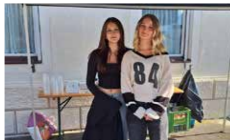
Auch Jugendliche aus dem Seelsorgeraum halfen bei der Agape mit.