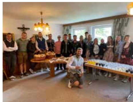
Das Erntedankfest am Haimingerberg wird jedes Jahr von den Jungbauern organisiert. Mit viel Engagement wird die Kirche mit Erntegaben geschmückt und eine Agape mit selbst gebackenem Brot vorbereitet.