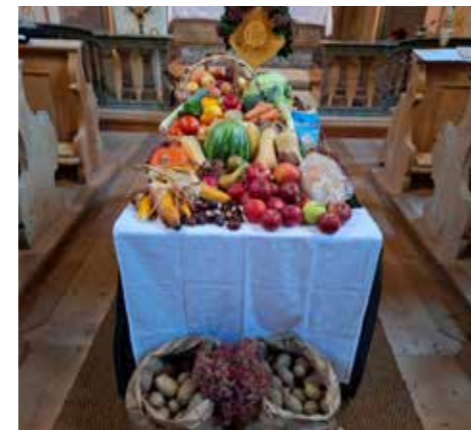
In Ochsengarten wurde Erntedank im Rahmen eines Familiengottesdienstes mit reich gefülltem Gabentisch gefeiert.