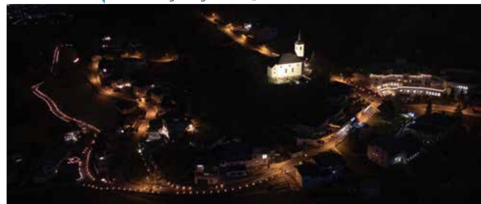
Blick von oben: Der mit Fackeln beleuchtete Weg von der Pfarrkirche zur Antoniuskapelle.