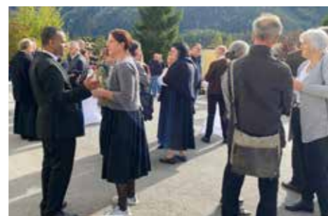
Agape nach der Messe am Kirchplatz.

Im Anschluss an die Hl. Messe lud der PGR zu einer großen, erweiterten Agape vor der Kirche. Das Herbstwetter war perfekt für ein gemütliches Beisammensein, genau am Ende der Messe kam die Sonne hinter dem Amberg hervor und sorgte für wärmende Strahlen.