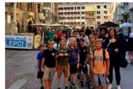
Die Minis aus Ötztal-Bahnhof besuchten in Innsbruck u. a. den Dom und die Altstadt.