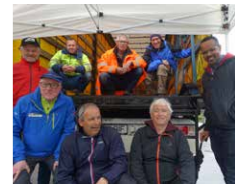
Seit 2002 organisiert die Kolpingfamilie Silz jährlich eine Kleidersammlung für Rumänien.