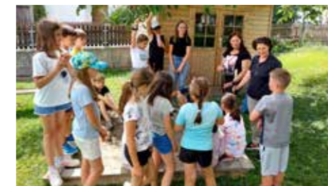
Einen feinen Sommertag in Silz konnten die Minis im Juli erleben.