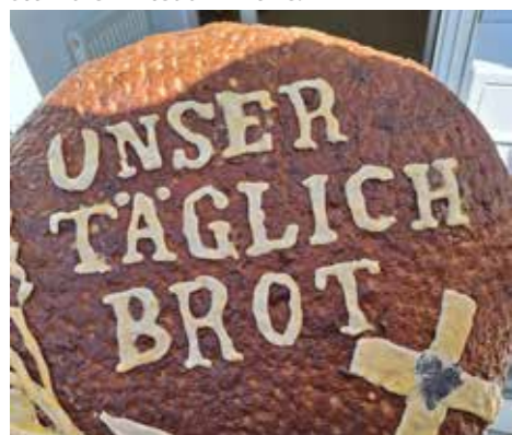
In Haiming wurde das Erntedankfest gemeinsam mit dem Patrozinium am 27. Oktober gefeiert.