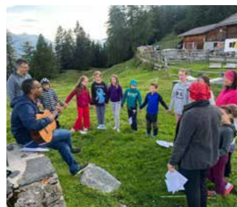
Die Haiminger Minis übernachteten auf der Haiminger Alm, pflegten die Gemeinschaft und Freundschaft und hatten viel Spaß.