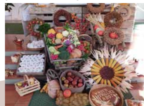
In Ötztal-Bahnhof wurde das Erntedankfest gemeinsam mit dem 60-Jahr-Jubiläum der Kirche gefeiert. Der Altarbereich wurde vom „Kreativteam“ wieder besonders liebevoll und bunt geschmückt.