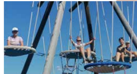
Die Kinder des Familiengottesdienst-Teams freuten sich über einen gelungenen Ausflug ins Widiversum in Hochoetz.

Seit mittlerweile einem Jahr gibt es unser Familiengottesdienst-Team. Sehr viele schöne und berührende Momente konnten wir in diesem letzten Jahr erleben, mit so viel Freude und tollem Einsatz unserer Kinder. Am 29. August organisierten wir als kleines Dankeschön einen Ausflug für die Kinder des Familiengottesdienst-Teams. Dieser führte uns nach Hochoetz, ins Widiversum. Bei Spiel, Spaß und gutem Essen nutzten wir den Tag mit den Kindern, die ja die Hauptdarsteller unseres Teams sind.