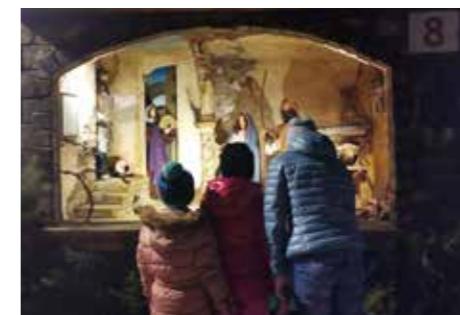
Die Silzer Adventfenster bieten Zeit zum Innehalten im Advent.

Täglich wird ein neues Adventfenster um 17:30 Uhr geöffnet (sofern nicht anders angegeben). Jedes Adventfenster wird von 17:30 bis 20:00 Uhr bis einschließlich 24. Dezember beleuchtet.