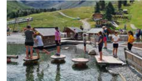
Die Minis vom Haimingerberg und aus Ochsengarten besuchten gemeinsam den Goldpark in Nauders.