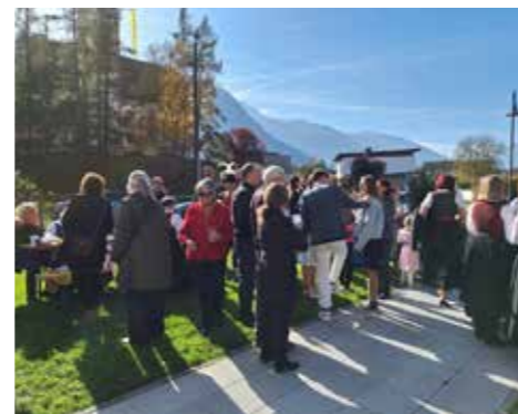
Nach dem Umgang gesellte man sich in gemütlicher Runde zusammen.