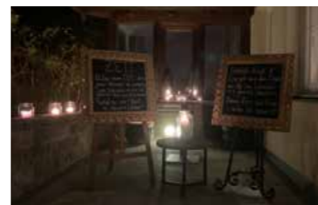
Station zur „Zeit“ beim Hotel „Das Schlössl“.