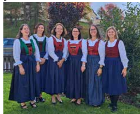
Auch Frauen des Turnvereins betätigten sich als „Fargeleträgerinnen“.