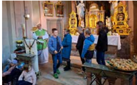
Erntedankfeier mit Familiengottesdienst.

Nach unserem Kirchtagsfest am 23. Juni stand in Ochsengarten als nächstes größeres Ereignis das Erntedank-Fest am 13. Oktober auf dem Programm. Diesen schönen Tag des Dankes und der Gemeinschaft feierten wir im Rahmen eines Familiengottesdienstes mit einem reichlich gefüllten Gabentisch in der Kirche.