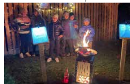
Feuerstellen der Jungfeuerwehr mit verschiedenen Gedanken zum Verbrennen.