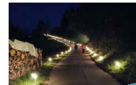
Der beleuchtete Weg zur Kapelle.