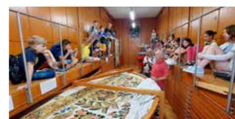
Auch die Silzer Minis waren in der Landeshauptstadt Innsbruck unterwegs.