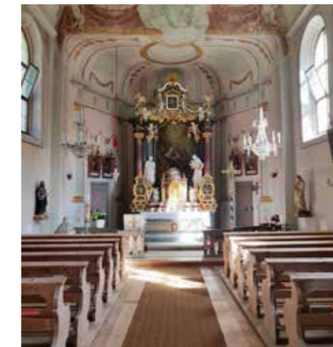
Die Kirche in Ochsengarten mit Widum gilt als Zentrum der Gemeinschaft.