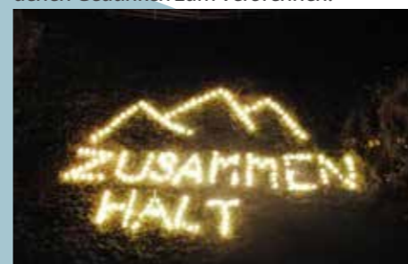
Fackelbild der Jungbauern.