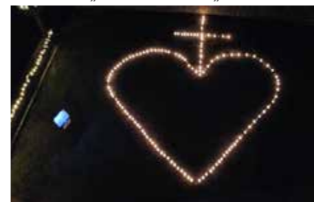
Herz-Jesu der Schützenkompanie.