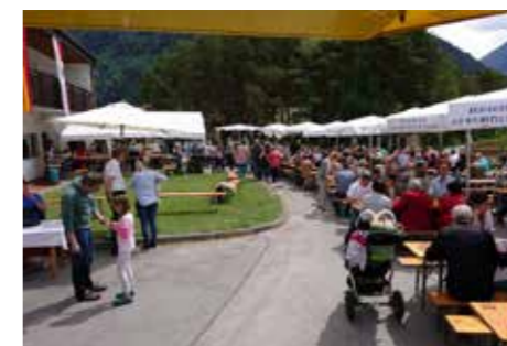
Zu den Fotos (von oben): Die Kirche zur Adventzeit - Orgel - Altarrelief - Pfarrfest.