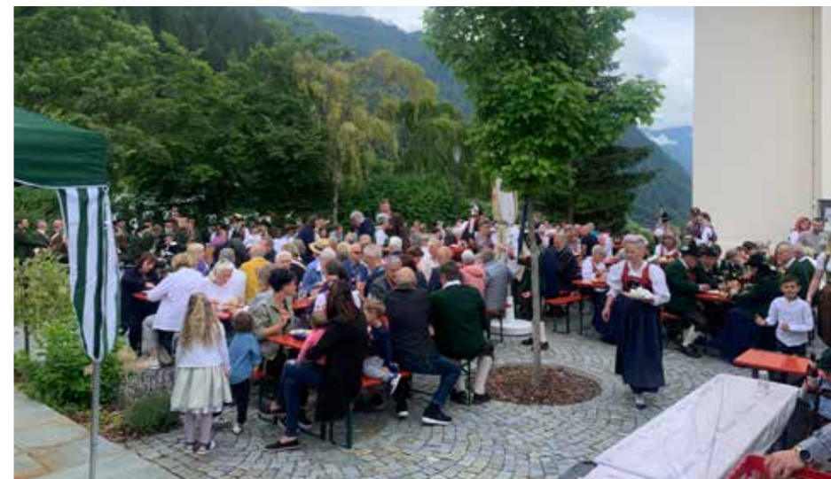
Das Kirchtagsfest am 2. Juli gehört zu den jährlichen Highlights am Haimingerberg.