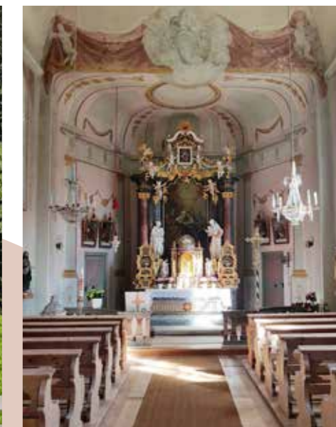
Innenraum und Altar von Ochsengarten.