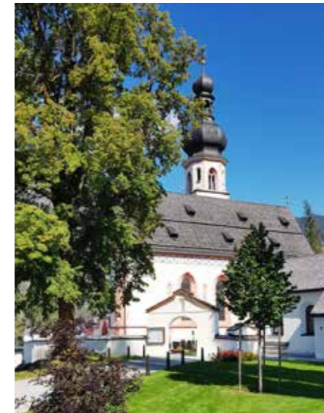
Die Haiminger Pfarrkirche von außen...

Text und Fotos: Tamara Pirchner, Obfrau PGR Haiming