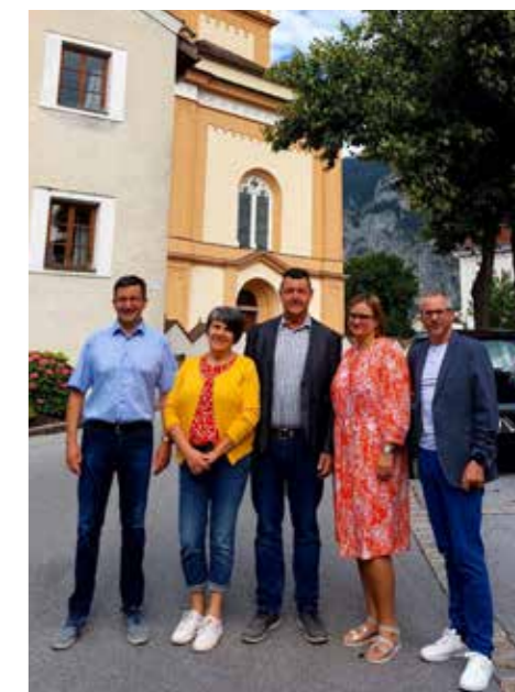
Der Pfarrkirchenrat von Silz.