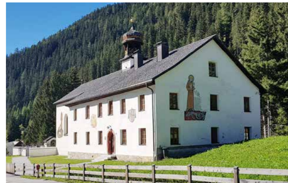
Die Kirche ist in einem bei uns ungewöhnlichen Verbund mit dem Widum erbaut.