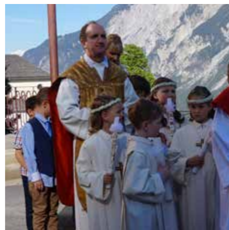
Erstkommunion am Haimingerberg 2016