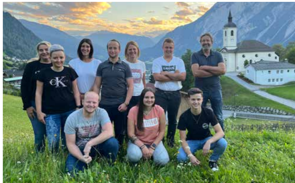
Der Pfarrgemeinderat von Haimingerberg - im Hintergrund die Kirche auf rund 1.000 m.

Der Haimingerberg mit rund 350 Einwohnerinnen und Einwohnern zeichnet sich unter anderem durch das gute Vereinsleben aus, von dem auch die Pfarrgemeinde sehr stark profitiert. Bei Prozessionen, dem Erntedankfest, dem Binden des Adventkranzes, der Nikolausfeier und anderen kirchlichen Feierlichkeiten kann